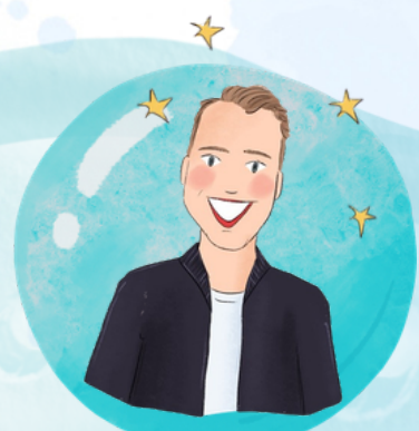
Meester Marijn Gym